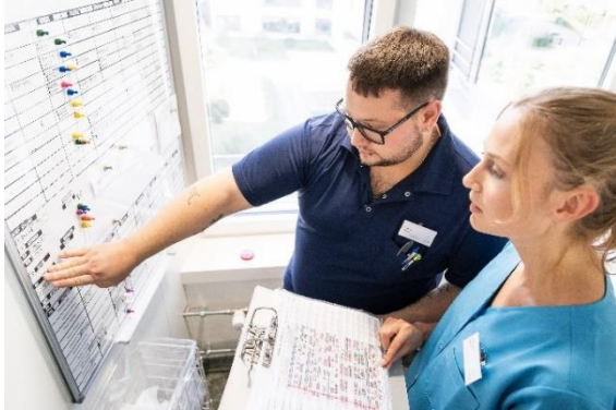
Bildbeschriftung: Mitarbeitende Solina bei der Einsatzplanung

Medienmitteilung Spiez, 18. November 2022