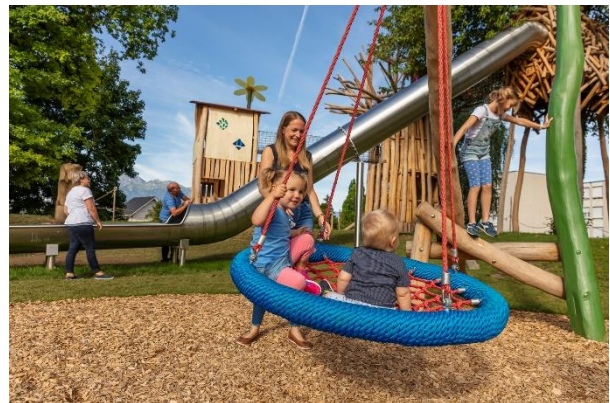
Bildbeschriftung: Impressionen aus dem Solina-Park