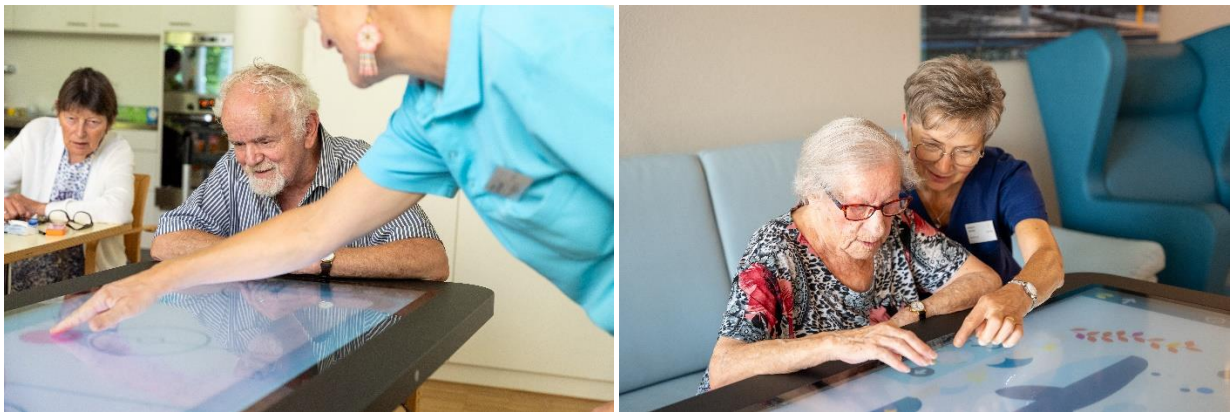
Bildbeschriftung: Ein Bewohner in Spiez und eine Bewohnerin in der Ziegelei sowie die betreuenden Mitarbeiterinnen bei der Nutzung des Care Table.